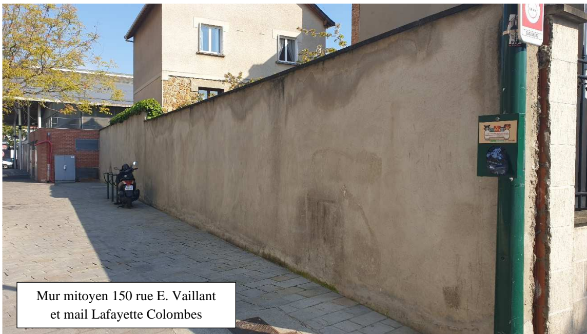
Mur mitoyen 150 rue E. Vaillant et mail Lafayette Colombes