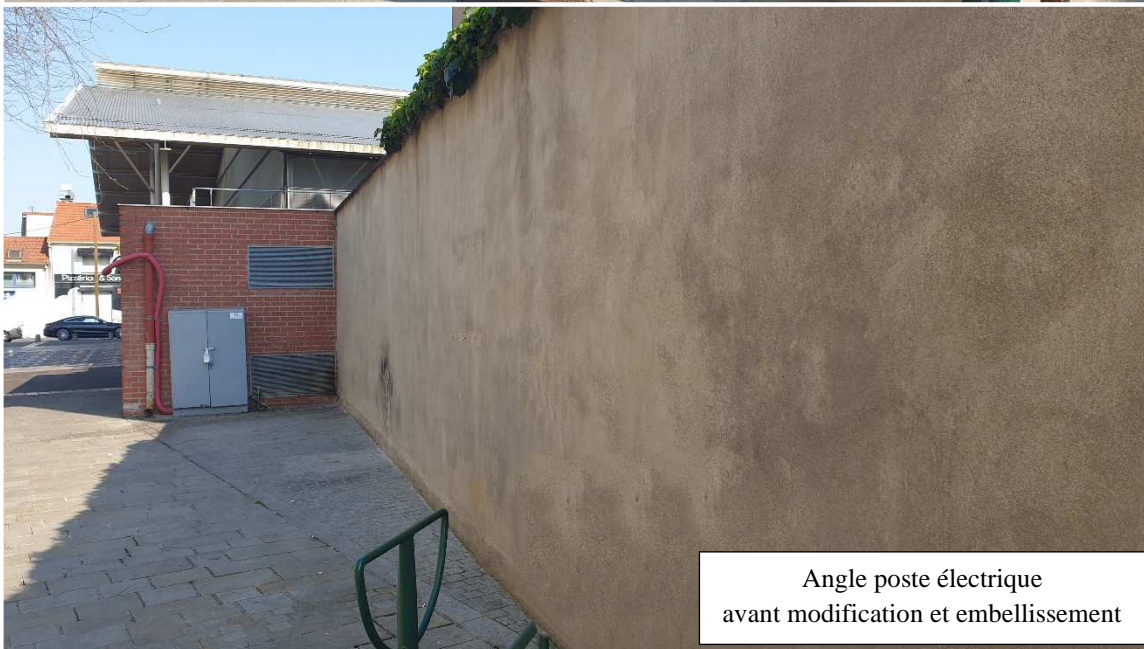
Angle poste électrique avant modification et embellissement