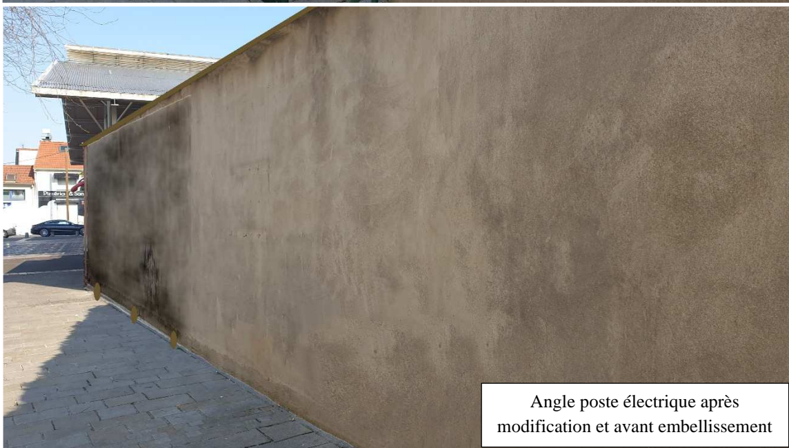
Angle poste électrique après modification et avant embellissement